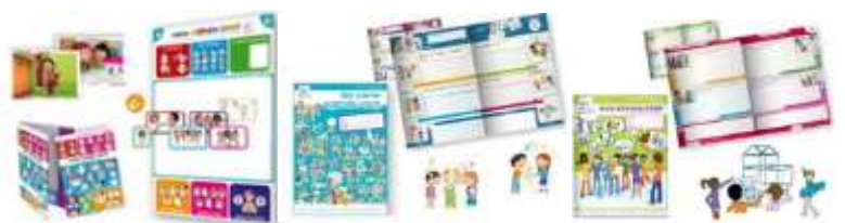
Agenda Cycle 1 Collectif

ATTENTION sans ré adhésion avant le 30 septembre , votre coopérative n'est plus assurée